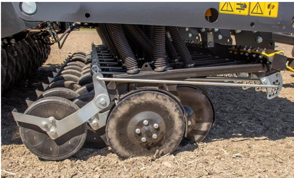
Obrázek 3) Botka Cerex, s jednotlivým nastavením hloubky u každé botky