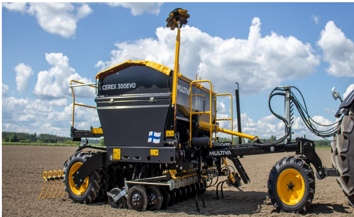
Obrázek 1) Mechanický secí stroj Multiva Cerex 300 EVO

Finský výrobce Dometal přináší na trh přepracované mechanické secí stroje Multiva FORTE EVO, CEREX EVO a také nové modely elektrických secích strojů eFORTE a eCerex.