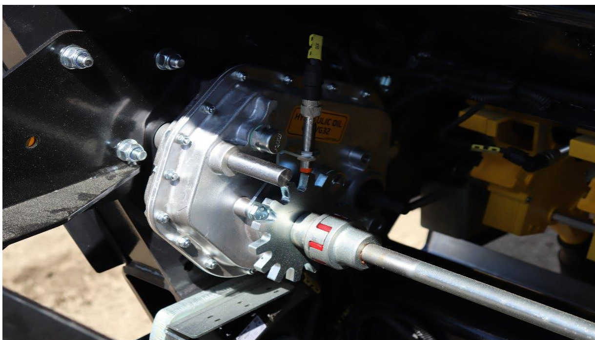
Obrázek 3) Gearbox