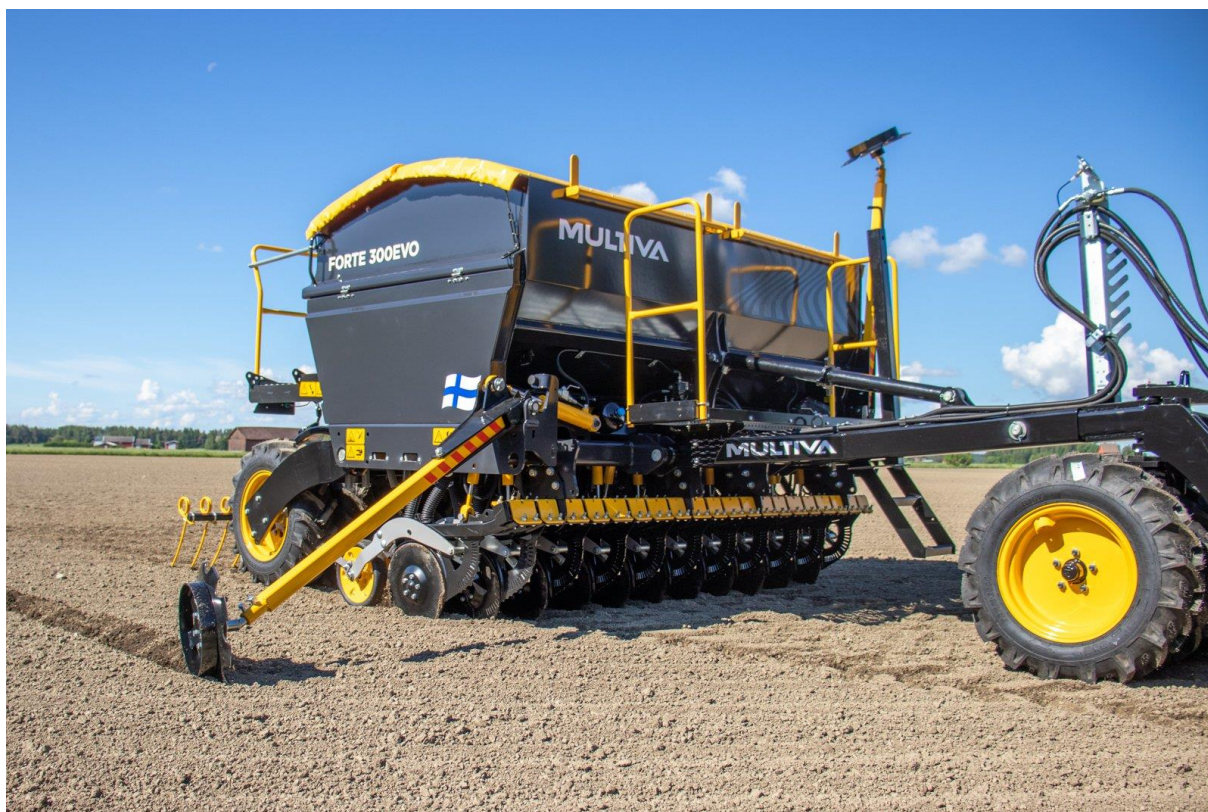
Obrázek 1: Ilustrační fotografie Multiva Forte 300 EVO

Secí stroje Multiva Forte EVO představují nejspolehlivější, nejuniverzálnější a nejpřesnější způsob setí na trhu. Secí disk FX je vyvinut tak, aby zajistil nejlepší agronomické výsledky v kombinaci se spolehlivostí a bezúdržbovou konstrukcí.